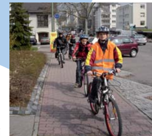
Auch die Kinder sind mit Begeisterung dabei