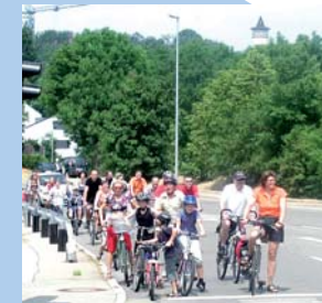
Gemeinsamer Spaß bei einer Tour durch Leonberg